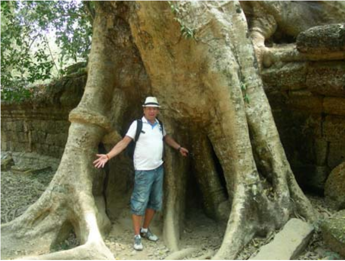
Jätteträden i TaPromtemplet.

Däremot var vi på en massagesalong där synskadade jobbar. Priset för en timmes massage är 6 USD och det var en upplevelse! När man förlorat synen så tar andra sinnen över och för dessa människor är det känslan i händerna som utvecklats. Fanns inte en knuta i hela kroppen som dom inte hittade! Och blandningen av smärta kontra avslappning gav en ny dimension. Dessa människor hade jag gärna tagit hem till Sverige och låtit dom arbetat här. Åker ni dit så rekommenderar jag detta stället varmt!