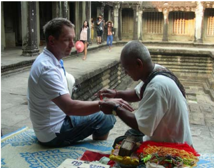
Ola blir välsignad av en munk.

Angkor Wat är mäktigt! Det är den största religiösa byggnaden i världen och på 1400-talet bodde det över 1 miljoner människor där. Området sträckte sig över 400 kvadratkilometer och innehåller ca 70 tempel. I mitten på 1400-talet erövrades templet och övergavs, sedan låg det bortglömt i över 400 år. Huvudtemplet är omgivet av en 200m bred vattengrav och hela området gör en förstummad. En mäktig sak var när jag blev välsignad av en munk i templet. Jag är inte troende, men när munken tog min hand, smekte min handled och sa några väl valda ord, fick jag en konstig känsla i kroppen. Jag skulle önska mig något innerligt och med munkens välsignelse skulle min önskan gå i uppfyllelse. För er som känner mig, så innehöll önskan ett grön/vitt avancemang under