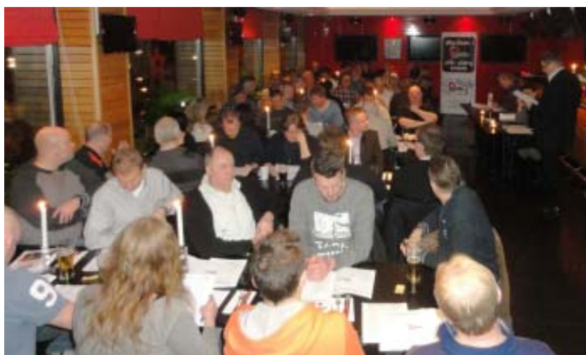
60 medlemmar var närvarande på mötet.