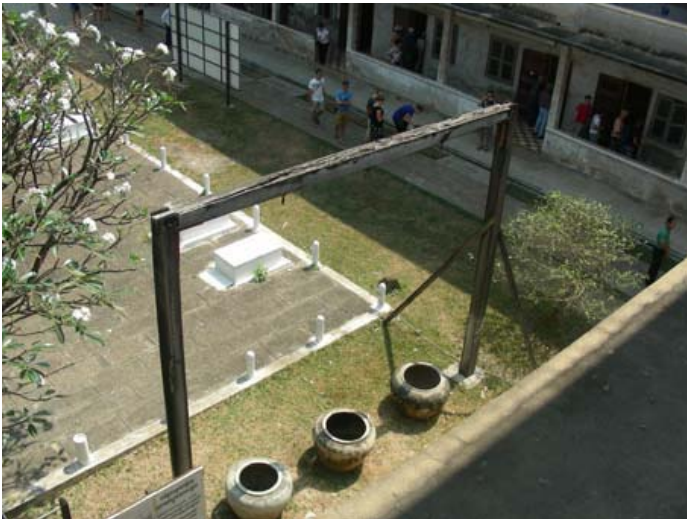
Bilden visar galgen med krukorna.

Nästa tripp i Phnom Penh gick till Tuol Sleng fängelset eller Office S.21 som även kallas. Återigen fick vi höra om fruktansvärda tortyrmeter! Bl.a band man ihop händerna bakom ryggen, knöt ihop fötterna och hissade upp personen i en galge med en stor kruka under, hängandes upp-o-ner. Där fick du hänga tills du tappade medvetandet. Då sänktes man ner med huvudet före i krukans så man vaknade. Krukans var fylld med likvatten och avföring! Då vaknade offret till liv, blev förhörd och fick fortsätta hänga upp-o-ner tills hela proceduren gjordes om på nytt. Detta pågick tills döden inträffade.