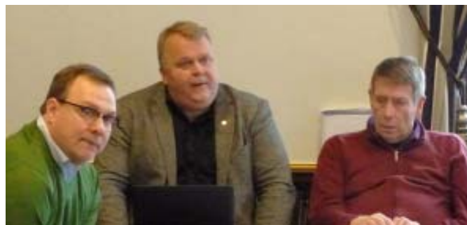
Några bilder från distriktsmötet