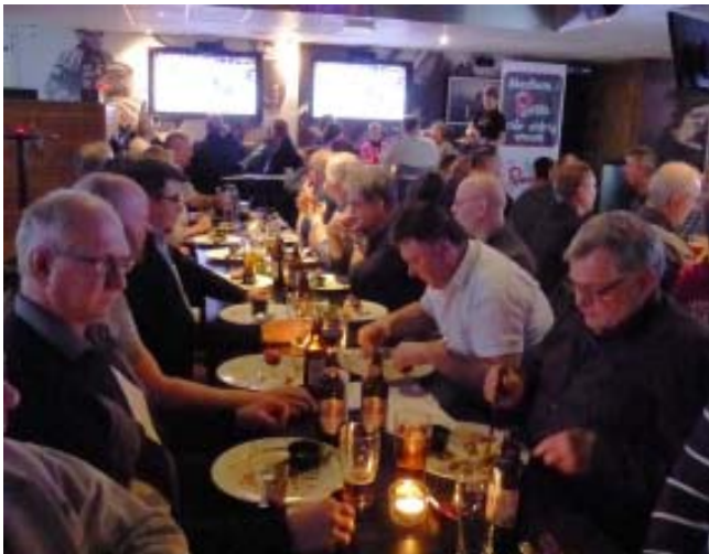
Bilder från årsmötet på restaurang Allstar.