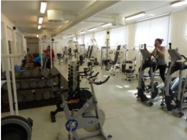
Bild på gymmet

Redaktionen gjorde ett besök på gymmet på gamla tvätten en måndag under lunchen. Vi pratade med några som var där. De var frekventa besökare sedan tidigare.