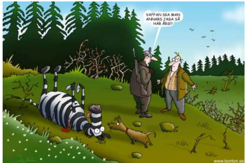
(Den här bilden gjorde jag när det egentligen inte var jakttid för något alls i skogen.)