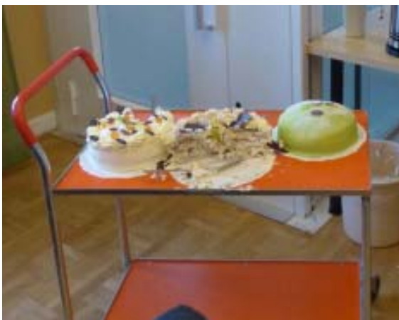
Flera olika sorters tårta fanns att välja på.