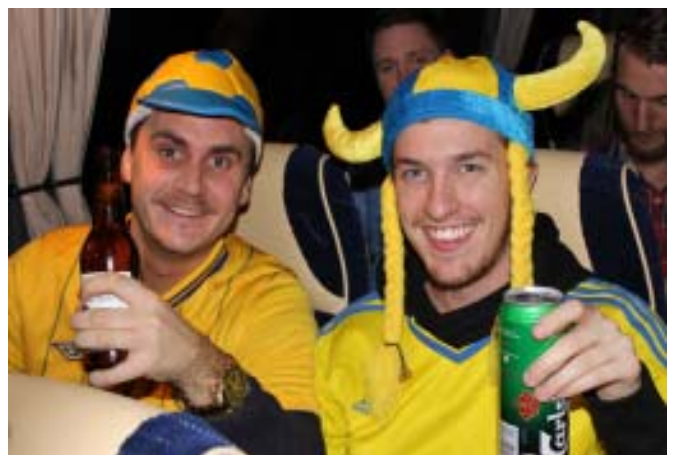
Två glada medresenärer