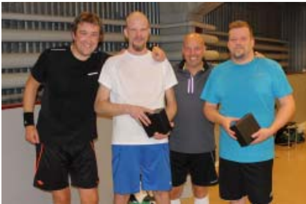
Prisutdelning till vinnande par.