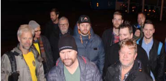
Några av de som var med

Sverige leder med 2-1 och matchen är helt öppen inför returmötet i Köpenhamn i tisdags.