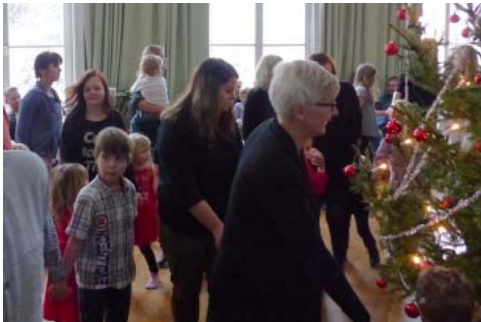
Det var full fart på dansen Det spritter i benen på både gammel som ung.